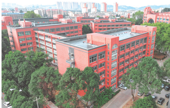
贵州电子信息职业技术学院贵阳校区。