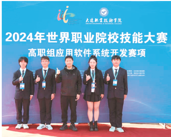
贵州电子信息职业技术学院在2024年世界职业院校技能大赛高职组应用软件开发赛项中获一等奖。