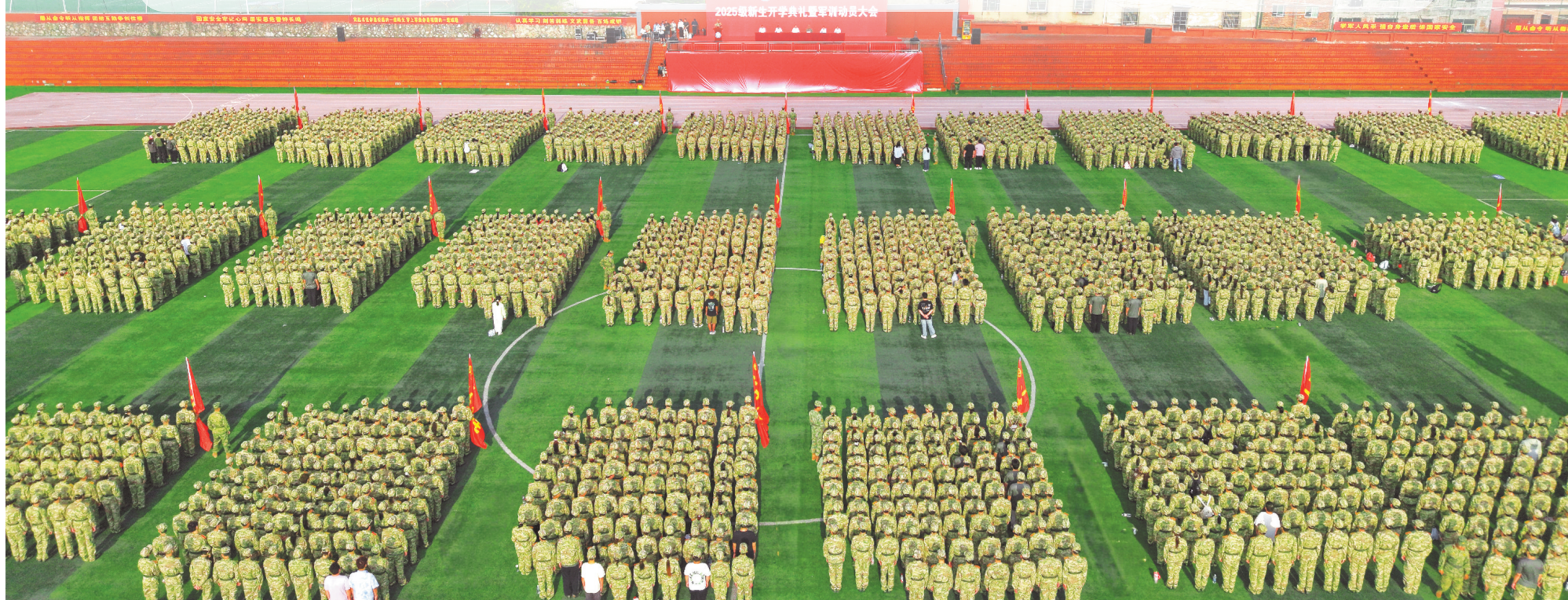
贵州电子信息职业技术学院贵阳校区2025级新生开学典礼暨军训动员大会。

浪前行。这所诞生于三线建设时期的学府，将红色基因融入血脉，把服务发展作为使命，书写了新时代职业教育的精彩答卷。 这里，每一天都在上演着“技能改变命运”的生动故事；这里，每一刻都在见证着“产教深度融合”的创新实践；这里，每一处都在彰显着“党建引领发展”的磅礴力量。