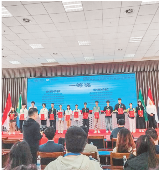
贵州电子信息职业技术学院学生获得2025“一带一路”暨金砖国家技能发展与技术创新大赛全国一等奖。