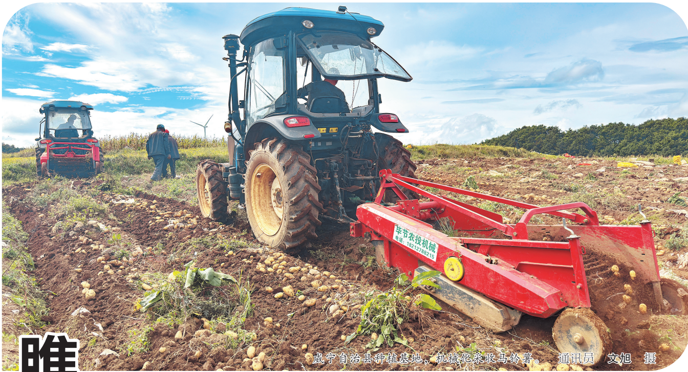
威宁自治县种植基地，机械正在田间作业。

近年来，纳雍县对已纳入监测的脱贫不稳定户、边缘易致贫户、突发严重困难户等“三类重点人群”，根据风险类别、发展需求等制定针对性帮扶措施，落实教育、医疗、住房等各项政策，大力发展到户产业、订单农业，加强就业帮扶，让脱贫群众在乡村全面振兴道路上不掉队、赶上来。