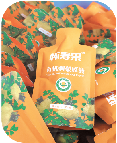
刺梨加工产品。

作为全省农业大市之一的毕节，立足山地禀赋，锚定“现代山地特色高效农业强市”建设目标，全力保障大宗农产品供应，壮大天麻、马铃薯、肉牛“三大重点产业”，做强蔬菜、茶叶、食用菌、水果、畜禽“五大特色优势产业”，因地制宜发展中药材、刺梨等其他产业，着力构建“1+3+5+N”特色农业产业体系，推动“三农”工作焕发新活力，农业农村经济跑出加速度，为推进乡村全面振兴、加快农业农村现代化筑牢坚实基础。