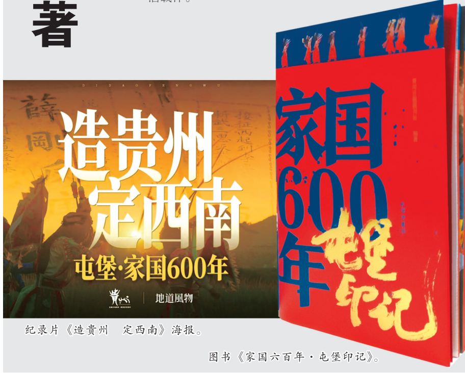
纪录片《造贵州 定西南》海报。