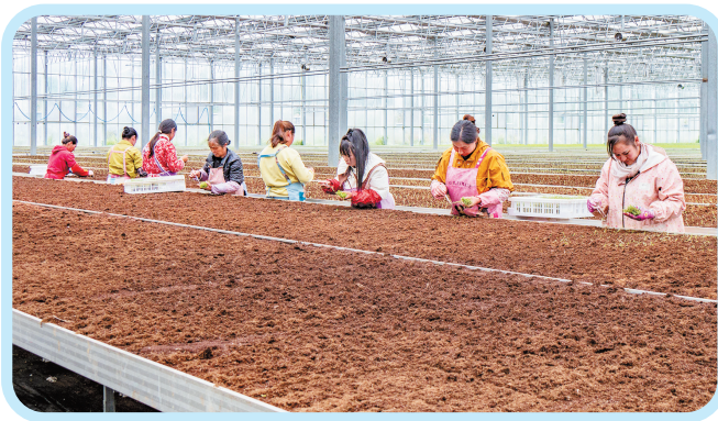
工人手握钳子将脱毒马铃薯原种种苗种到高架苗床上。