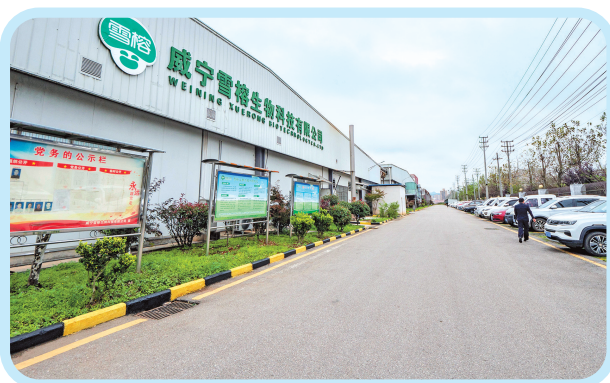
威宁雪榕生物科技有限公司办公区。