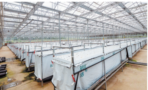
培育马铃薯原原种的无土栽培苗床。