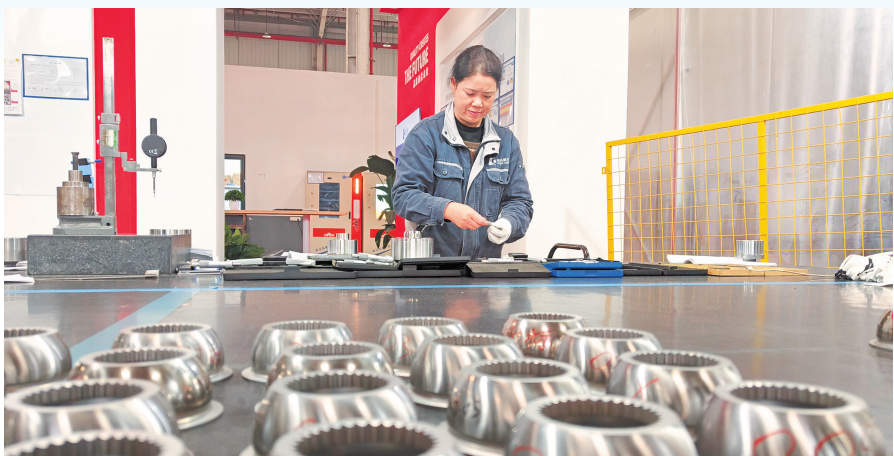
工作人员正在检验产品。

党的二十届四中全会提出，加快高水平科技自立自强，引领发展新质生产力。要加强原始创新和关键核心技术攻关，推动科技创新和产业创新深度融合，一体推进教育科技人才发展，深入推进数字中国建设。