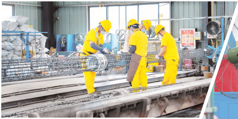
↑ 精一电力器材工人进行部分预应力钢筋笼绑扎。通讯员 王丹丹 摄