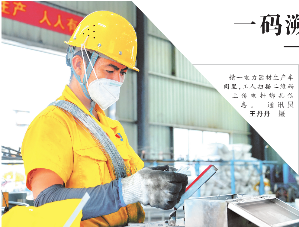
精一电力器材生产车间里，工人扫描二维码上传电杆绑扎信息。

截至目前，安顺高新区累计培育国家级专精特新“小巨人”企业4家、省级专精特新“小巨人”企业4家、省级“专精特新”中小企业28家。这些以科技创新谋发展、正成长为安顺高新区高质量发展的主力军。