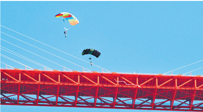
参赛选手在世界第一高桥上空翱翔。