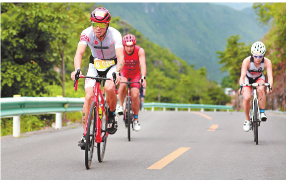
参赛选手骑行在喀斯特地貌的自行车赛道上。

世界桥梁看中国，中国桥梁看贵州。在花江峡谷大桥正式通车并逐步开放各方面文旅体项目运营的今天，伴随着贵州“赛动黔景”品牌一次次在山地户外运动玩法的极限拓展，“体育+旅游+桥梁”开发模式也将世界目光聚焦贵州，营造出极佳的国际传播声量。