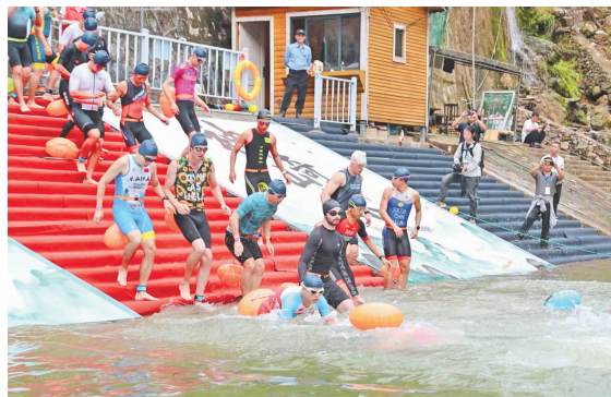
参赛选手在北盘江水域进行游泳项目。