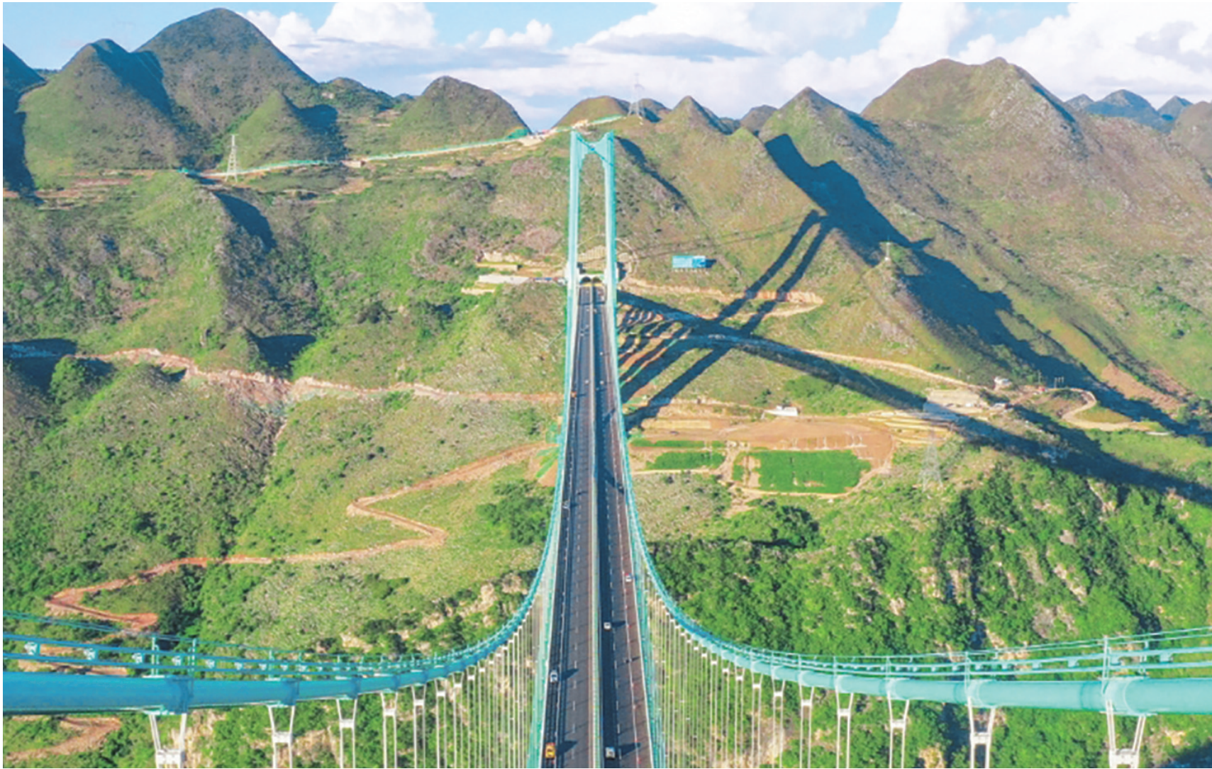
9月28日14时20分,社会车辆开始驶上花江峡谷大桥。