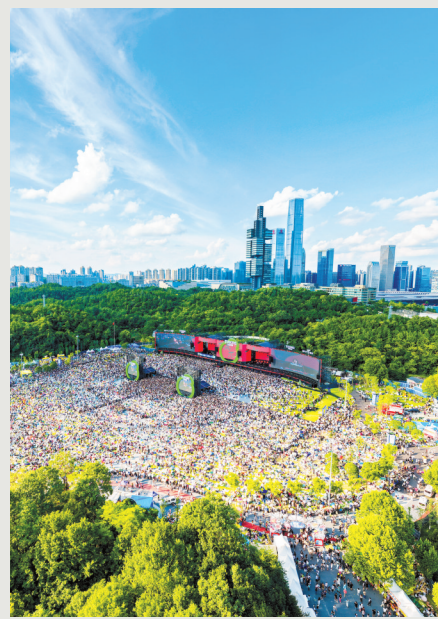
2025Z纪元银河左岸音乐节演出现场航拍图。

贵州好戏“大餐”不断，带动了文旅发展。数据显示，2025年上半年，贵州全省接待游客同比增长82%，旅游总花费增长106%。