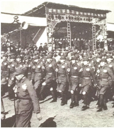
淞沪会战战场上的中国士兵。