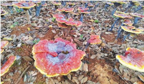
兴义普子村种植的林下灵芝。

截至目前，黔西南州林下经济经营和利用林地总面积达 233.26万亩 。其中林下种植面积为 36.24万亩 ，产量 6.29万吨 ，主要种植有石斛、灵芝、天麻等中药材和食用菌；林下养殖总面积 49.68万亩 ，涵盖林下养禽、林下养畜和林下养蜂。