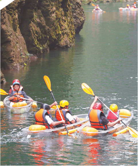
游客在铜仁大峡谷游玩。