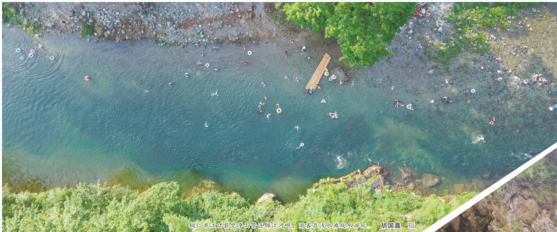
铜仁市江口县梵净山景区锦江河畔，游客在浅水滩戏水游玩。