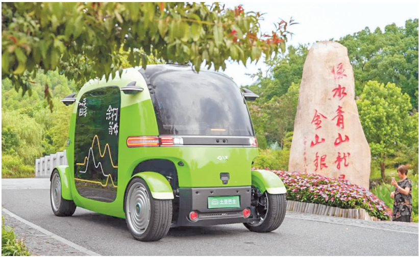
土豆巴士主要发挥景区接驳、商品零售等作用。