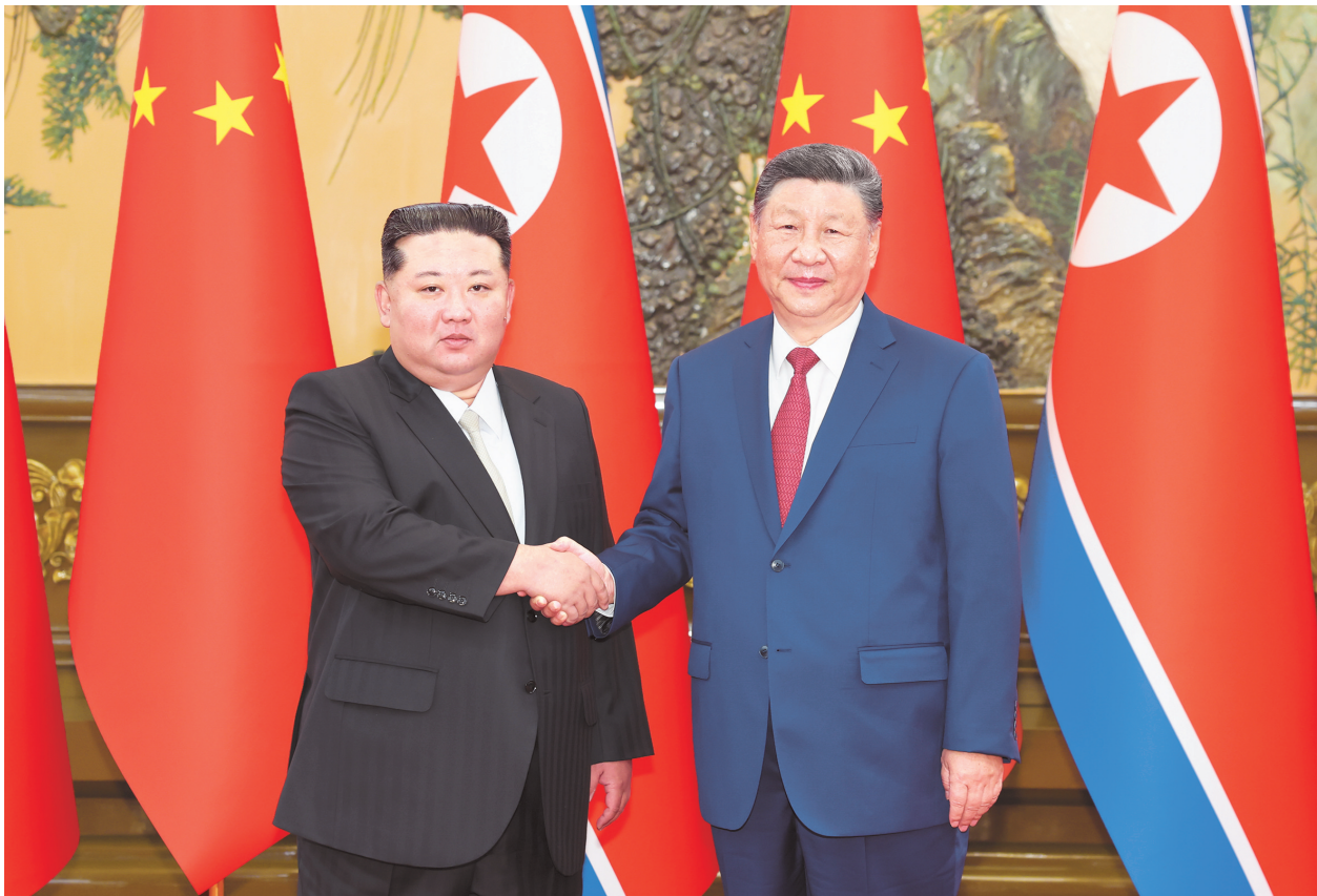
9月4日晚，中共中央总书记、国家主席习近平在北京人民大会堂同来华出席纪念中国人民抗日战争暨世界反法西斯战争胜利80周年活动的朝鲜劳动党总书记、国务委员长金正恩举行会谈。