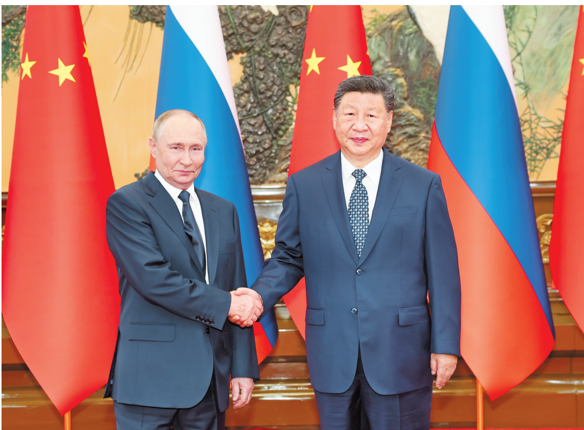
九月二日上午，国家主席习近平在北京人民大会堂同俄罗斯总统普京举行会谈。

新华社北京9月2日电（记者杨依军 曹嘉玥）9月2日上午，国家主席习近平在北京人民大会堂会见来华出席2025年上海合作组织峰会和纪念中国人民抗日战争暨世界反法西斯战争胜利80周年活动的俄罗斯总统普京举行会谈。