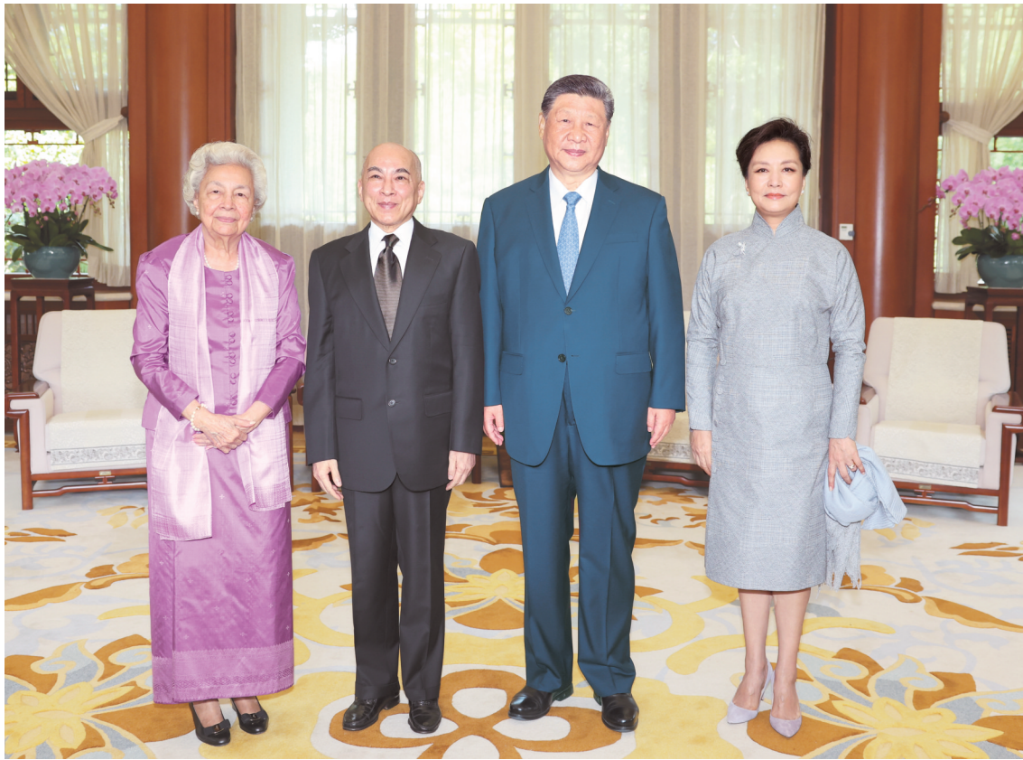
八月二十六日上午，国家主席习近平和夫人彭丽媛在北京中南海亲切会见柬埔寨国王西哈莫尼和太后莫尼列。

新华社北京8月26日电 8月26日上午，国家主席习近平和夫人彭丽媛在中南海亲切会见柬埔寨国王西哈莫尼和太后莫尼列。 习近平热烈欢迎西哈莫尼国王和莫尼列太后再次来华，也欢迎西哈莫尼国王出席中国人民抗日战争暨世界反法西斯战争胜利80周年纪念活动。习近平表示，今年4月我对柬埔寨进行国事访问，受到国王陛下和柬埔寨人民热情友好接待，至今想起都感到