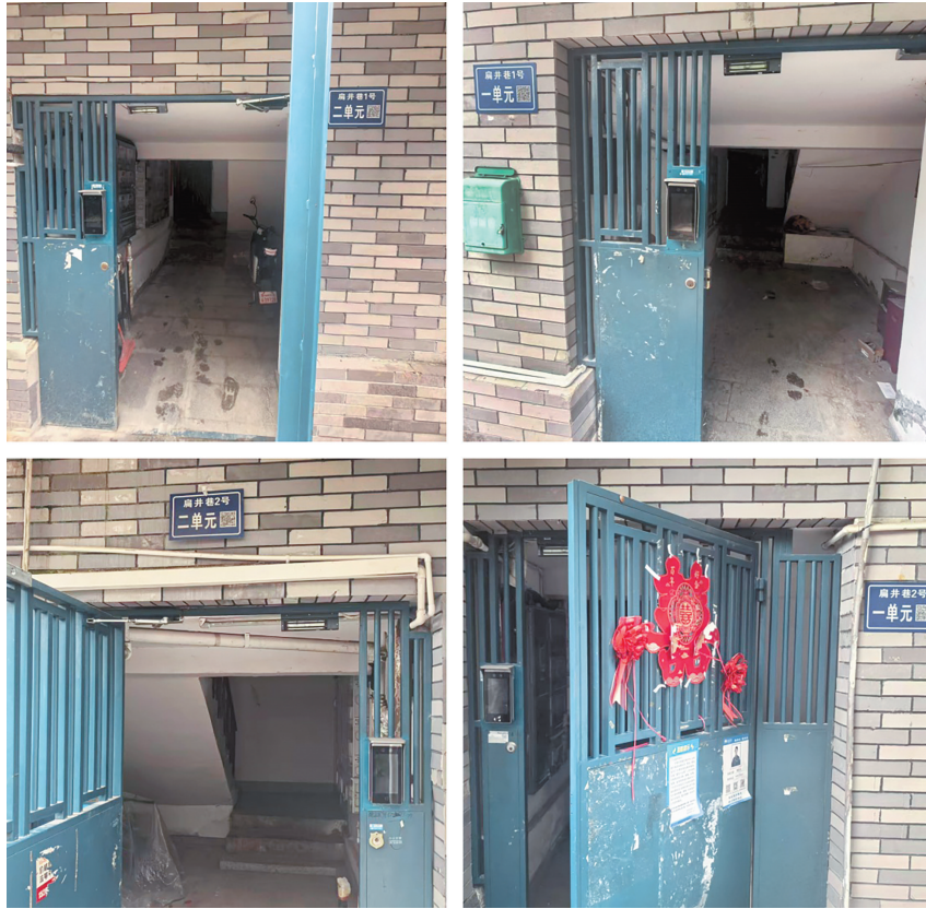
扁井巷大部分院落单元楼门禁均未通电使用。

近日,“天眼问政”栏目接到网友反映,贵阳市云岩区盐务街扁井巷小区虽已完成老旧小区改造,但存在诸多问题。