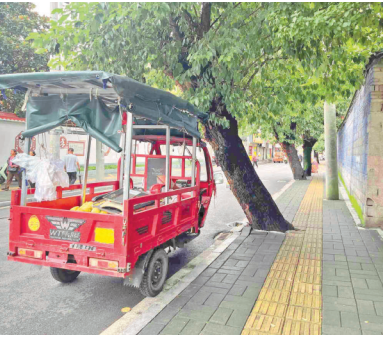
行道树倾斜到马路上。