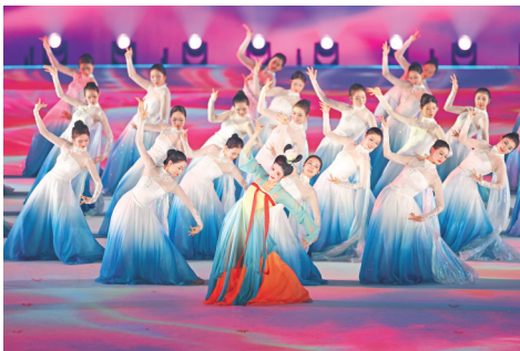
↑ 8月7日，演员在开幕式上表演。