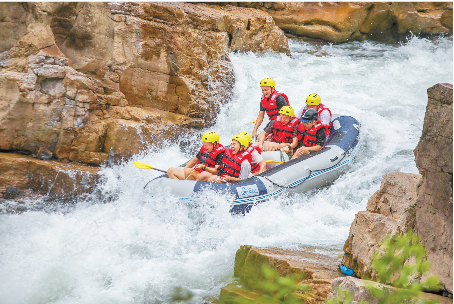
黔东南州贵定县洛北河漂流景区近日迎来客流高峰，惊险刺激又清凉惬意的漂流让这里成为热门之选，月接待游客超4.5万人次。图为8月7日，游客在此尽情体验漂流乐趣。

安顺古城历史文化街区不断丰富文旅产品，7月游客量高达210万人次，比2024年同期增长105.96%。去哪儿大数据研究院分析，随着交通等基础设施完善和服务升级，游客更愿“慢下来”体验小城游，安顺正成为游客心中的理想之选。