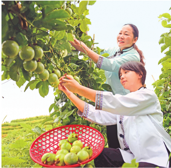
黔东南州从江县调整农业产业结构，以“合作社+农户+市场”模式种植百香果促农增收。图为8月7日，从江县西山镇小丑村村民在基地采摘百香果。

目前，全省各地法院初步探索形成了一批可复制、可推广的实践经验。铜仁中院组织执行听证案件317件，促成和解30件，履行完毕17件，到位金额6379万元；黔东南州中院召开执行听证220次，有效化解执行案件矛盾纠纷40件。