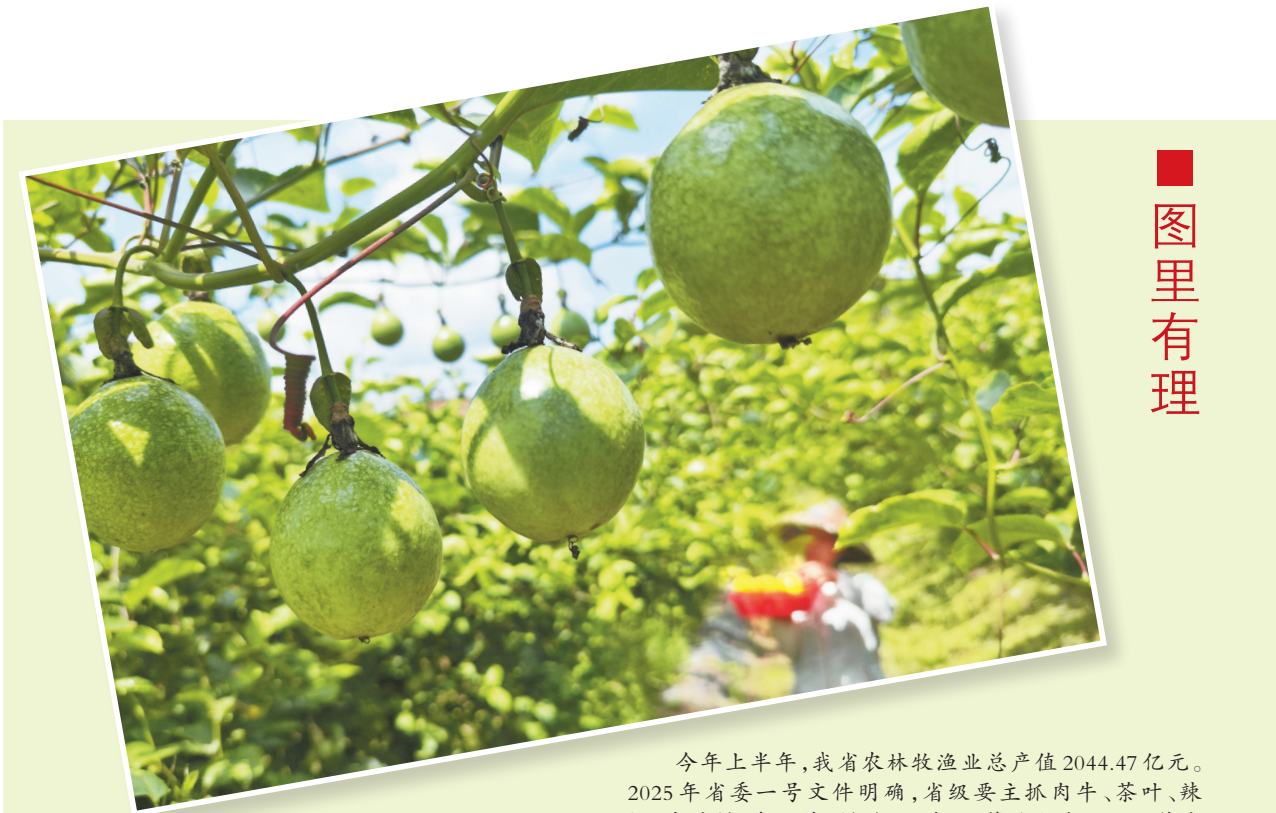
▲黔东南州榕江县寨章百香果种植基地，村民在采摘百香果。

与此同时，贵州立足群众精神文化需求，以公共文化服务设施补短板 and 数字化服务效能提升为抓手优化城乡公共文化服务，建立优质公共文化服务资源直达基层机制，不断丰富基层文化生活。 在黔东南州台江县，“村BA”火热举行。“多一场球赛，少一桌麻将”，台江以“村BA”为抓手优化乡村文化服务，在不断满足群众体育运动和精神文化生活需要的同时，还涵养了文明新风。与“村BA”逻辑一致的“村超”“村T”“村晚”“村马”等“村”字头文体活动纷纷涌现。为推进文明创建，习水创作了音乐快板《做文明有礼习水人》，湄潭兴隆镇龙凤村田家村村民自编自演自唱花灯戏词《十谢共产党》……贵州各族群众通过花灯戏、山歌、剪纸、快板等传统艺术，让社会主义核心价值观以文化服务的形式融入百姓生活，在潜移默化中实现移风易俗。以文化服务为媒，推进文化繁荣与经济发展齐头并进，培育起城乡文明新风的