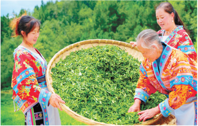
茶农在分拣采贝茶叶。

新“金融+文旅”融合发展新模式，充分发挥融资、融智和融商优势，以多维度综合金融服务，支持贵州做强旅游品牌、做大产业蛋糕，实现“一业兴、百业旺”的乘数效应，夯实“全域旅游”金融基底。 当文化之韵邂逅金融之力，“一日游”变深度游、“流量”变“留量”的美好蓝图正在多彩山水间化为万千游客“一生必来一次贵州”的美好愿景，持续推动贵州文旅出圈出彩。