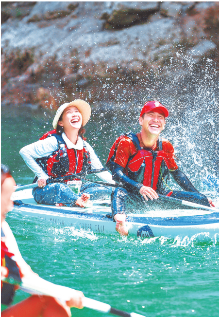
8月3日，遵义市绥阳县清溪峡景区迎来客流高峰，游客在碧波荡漾的湖面嬉水游玩，尽享夏日清凉。

据统计，野玉山景区内现有成规模民宿酒店18家，提供客房705间、床位1319个。随着避暑游热度持续走高与彝族火把季系列活动全面启动，景区住宿正迎来接待高峰。