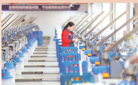
黔东南锦屏经济开发区贵州亚狮龙体育文化产业发展有限公司羽毛球生产线上。

从传统产业“老树发新芽”到新兴产业“新枝结硕果”，从重大项目“落地生根”到文旅体融合迸发新活力……贵州坚持以高质量发展统揽全局，在中国式现代化进程中展现贵州新风采。