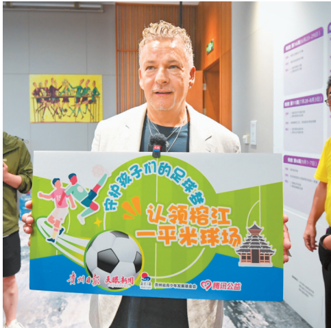
7月26日，传奇球星罗伯特·巴乔（左）、罗伯特·卡洛斯（右）落地贵州，参加“认领榕江一平米球场”公益行动。

■ 7月26日，第二届阳明心学论坛在筑开幕，紫荆文化集团董事长许正中，省委常委、省委统战部部长郭强出席并致辞，北京大学著名教授楼宇烈视频致辞，省领导张光奇出席，海内外研究阳明心学知名专家学者60余人参加。