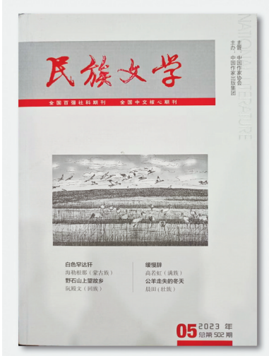
杨芳兰中篇小说《牛霸一方》刊发于《民族文学》2023年第五期。

西班牙女作家蒙特罗曾说，“小说家要追寻内心的潜意识，去挖掘现实之下自己都不曾发觉的自我。”侗族女作家杨芳兰面对女性潜意识世界，以女性视角，将女性潜意识予以物化，在作品中将女性人物丰盈的精神面向予以呈现。