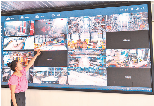
技术员在查看监控。