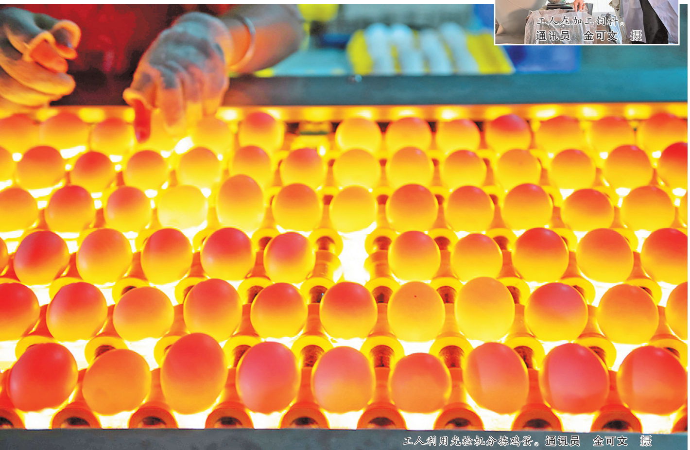
工人利用光检机分拣鸡蛋。