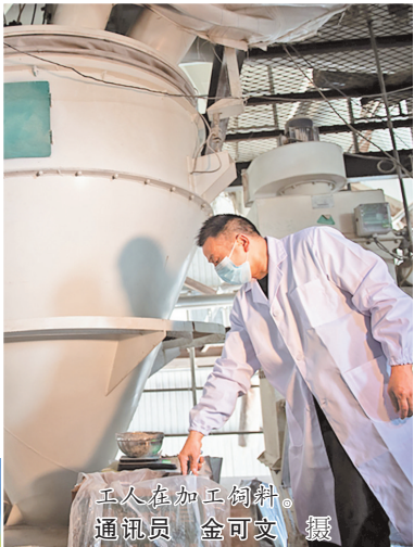
工人在加工饲料。