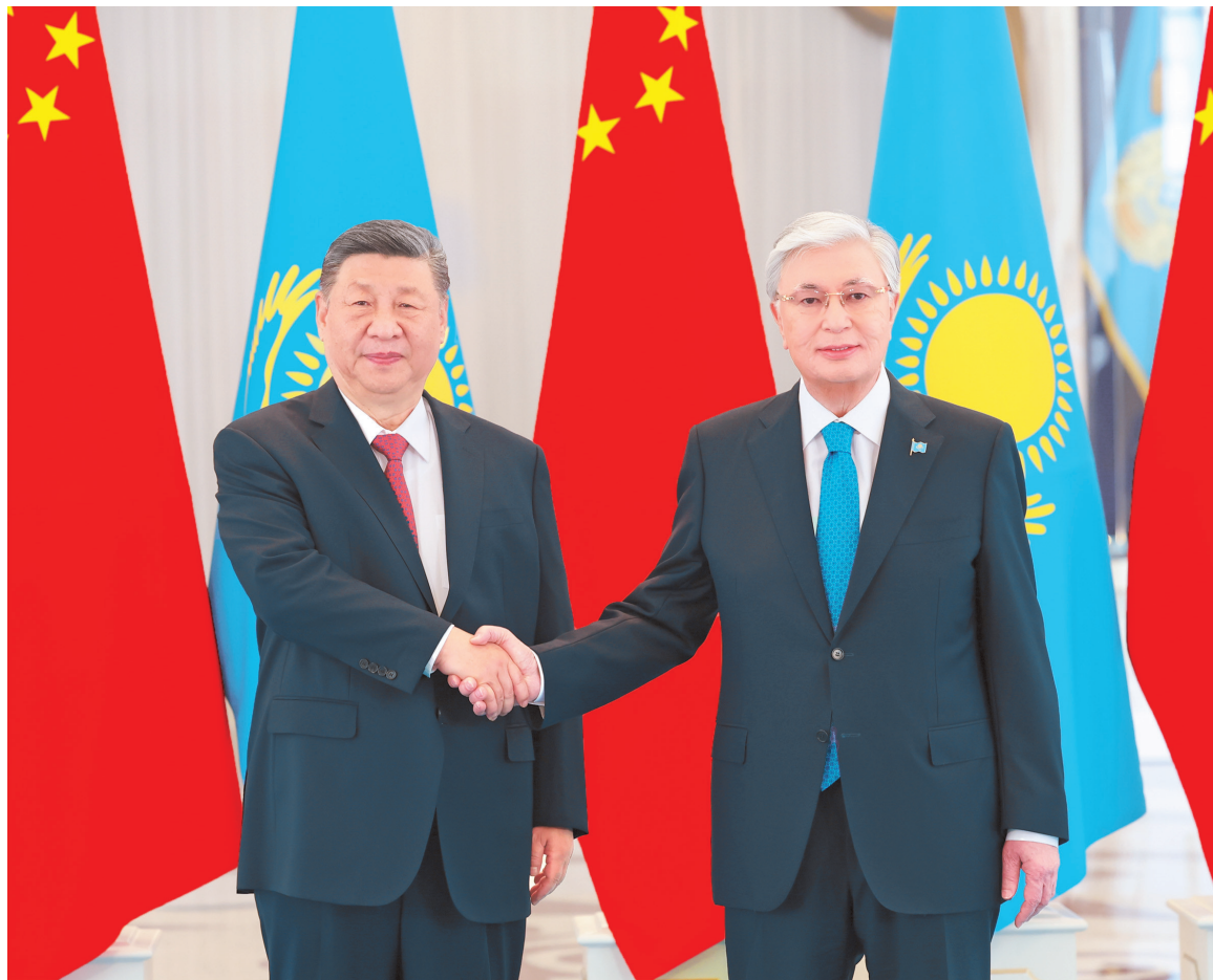
当地时间六月十六日下午，哈萨克斯坦总统托卡耶夫同中国国家主席习近平在阿斯塔纳总统府举行会谈。