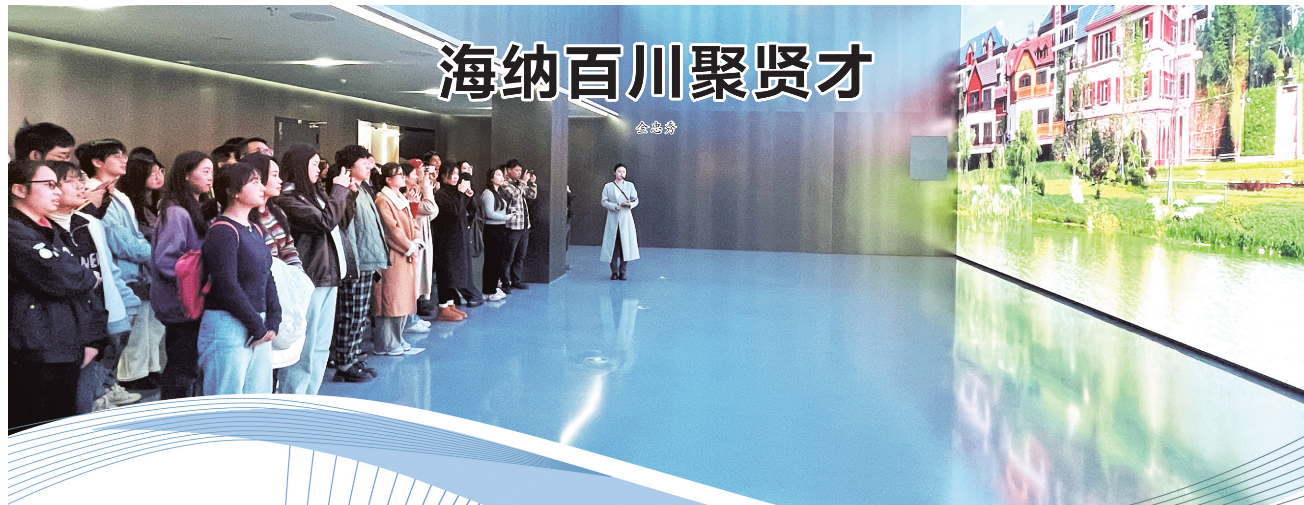
海纳百川聚贤才 金忠秀 贵安新区组织青年人才参观贵安新区城规馆