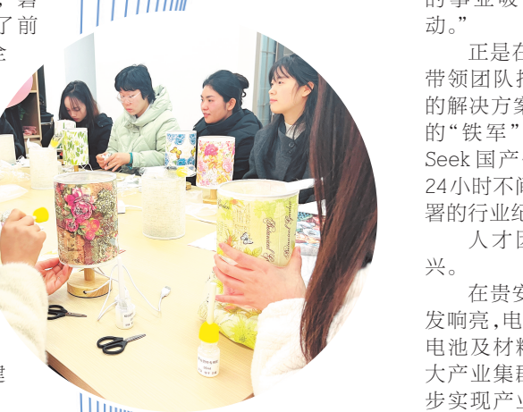
青年社区沙龙活动。