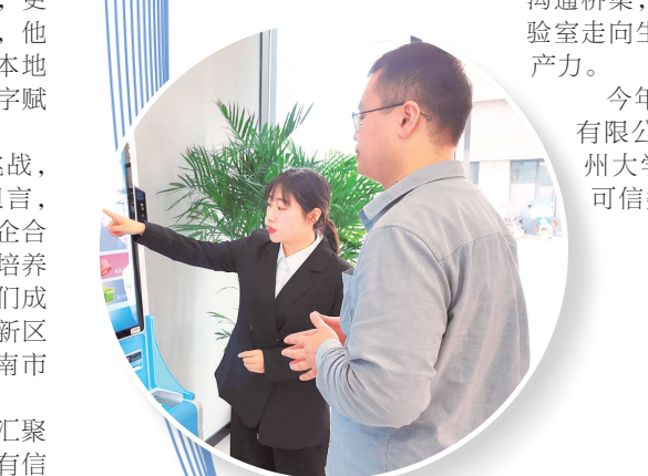
贵阳大数据科创城企业人才服务中心。