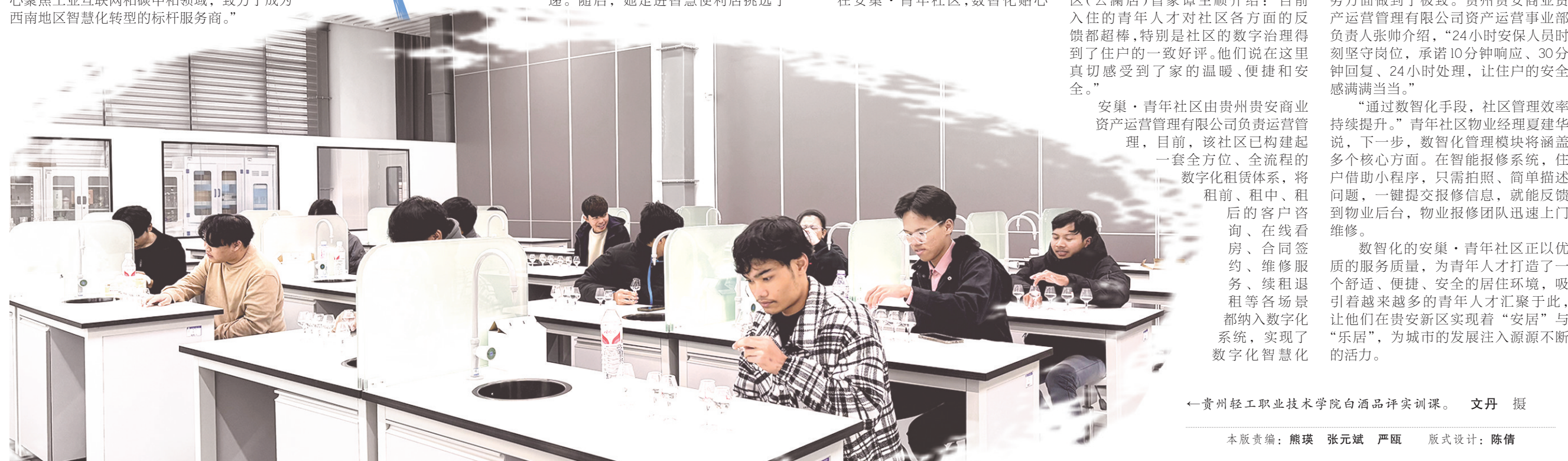
←贵州轻工职业技术学院白酒品评实训课。

海纳百川，近悦远来。 贵安新区正处在高质量发展的关键进程中，迫切需要人才快速导入，各领域千万人才竞相奔涌、建功立业。从数据上来看，截至目前，贵安新区人口总量达46.4万人，其中人才突破9.5万人。