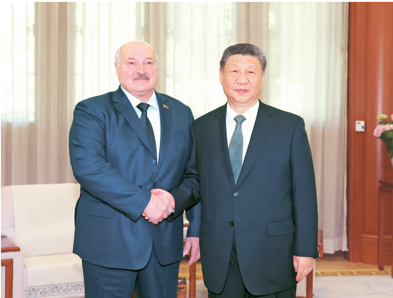
六月四日上午，国家主席习近平在北京中南海会见白俄罗斯总统卢卡申科。