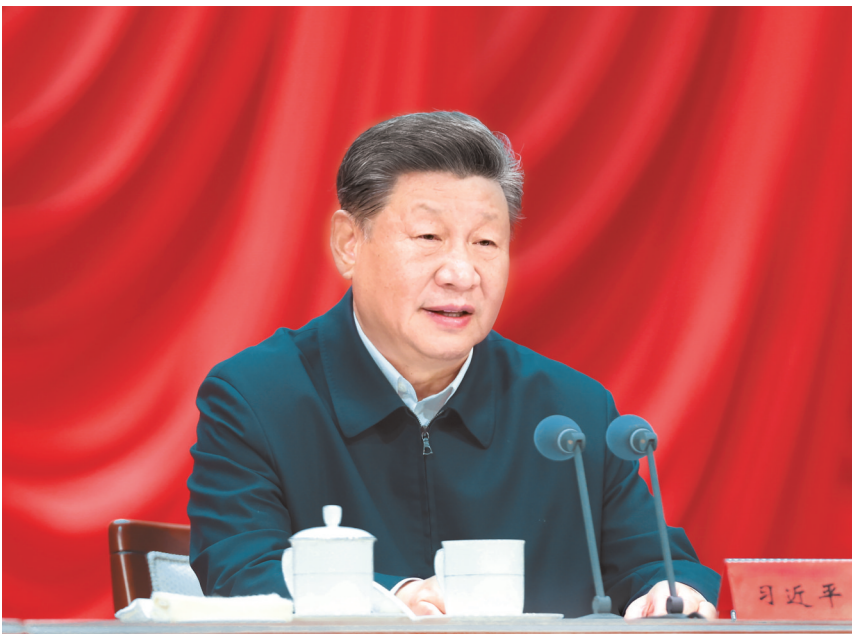
10月29日，省部级主要领导干部学习贯彻党的二十届三中全会精神专题研讨班在中央党校（国家行政学院）开班。中共中央总书记、国家主席、中央军委主席习近平在开班式上发表重要讲话。

习近平指出，改革是一项系统工程，需要讲求科学方法，处理好方方面面的关系。要坚持改革和法治相统一，以改革之力完善法治，进一步深化法治领域改革，不断完善中国特色社会主义法治体系；更好发挥法治在排除改革阻力、巩固改革成果中的积极作用，善于运用法治思维和法治方式推进改革，做到重大改革于法有据，平等保护全体公民和法人的合法权益。要坚持破和立的辩证统一，破立并举、先立后破，该立的积极主动立起来，该破的在立的基础上及时破，在破立统一中实现改革蹄疾步稳。要坚持改革和开放相统一，稳步扩大制度型开放，