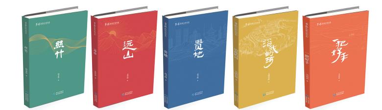
“多彩民族文学书系”（第1辑·5种）

需要，积极助推贵州建设铸牢中华民族共同体意识模范省。其中，《远山》以毛南族聚居村为背景，反映了毛南族群众的纯朴、友善，以及对美好生活的追求，对传统文化的虔诚和崇敬。《贵地》是一部立足当代、体现新时期贵州特质的诗集。诗文集展现了独特的贵州山水画面，带领读者漫游贵州名胜。《丝竹》以民族传统乐器——箫为线索，描写了非物质文化遗产传承的现状，展示了非物质文化遗产如何成为助力脱贫攻坚的有力力量。《一把好手》以云贵高原小县茶城的生活为背景，记述了普通人的日常生活，反映了老百姓对美好生活的向往与努力。《浴我的河》全景勾勒了沃里坪教育的百年历程，阐释了民族教育工作者们的可贵自觉，见证了新一代又一代民族教育工作者们的不懈奋斗场景。这些作品既展现了民族交往交流交融的场域，又展示了巩固拓展脱贫攻坚成果与乡村振兴有效衔接的贵州实践。