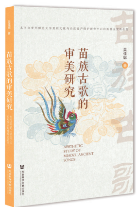
《苗族古歌的审美研究》

苗族的历史悠久，在漫长的人类文明发展过程中，形成了具有典型山地民族特征的文化形态。苗族具有独特的生产方式和生活方式，具有独特的社会组织形式和管理方式，具有独特的民俗习惯和伦理道德观念。苗族人民善于歌舞，其中木鼓舞、芦笙舞等形式丰富多姿，令人叹为观止。因此，苗族有“歌舞的民族”之美誉。同样，苗族的服饰文化特色鲜明，刺绣、织锦、蜡染、银饰制作等工艺美术，瑰丽多彩。苗族节日多，各种仪式隆重，自古以来就有“鼓藏节”“苗年”“召龙节”“吃新节”等难以计数的节庆，表现了人类与天地交流沟通、万物相连相和的深层底蕴。可以说，璀璨而神秘的苗族文化系统，构建了这一古老民族信仰世界和世俗生活的全部内容。然而，对这样一种独特的文化现象，国内学术界重视得还是远远不够的。长期以来，国内的研究界虽然有一些颇具分量的整理文本和研究著作出现，但是与这一文化的重要性而言，还远远没有达到它应有的重视程度和研究高度，有些领域研究还没有充分展开。