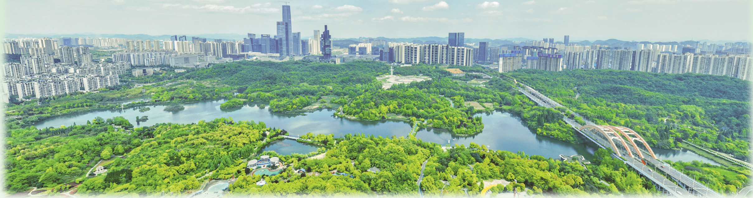
城市“绿肺”观山湖公园。