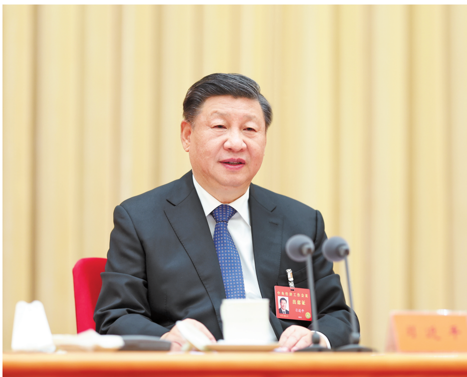
12月15日至16日，中央经济工作会议在北京举行。中共中央总书记、国家主席、中央军委主席习近平出席会议并发表重要讲话。