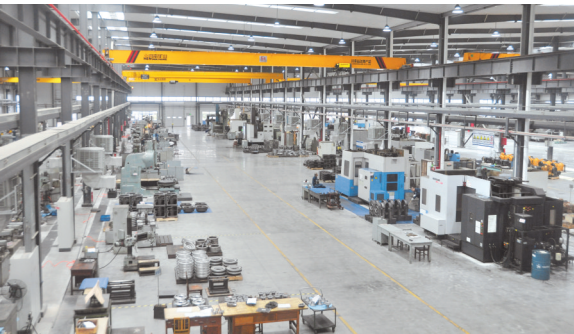
贵州凯星液力传动机械有限公司生产现场。