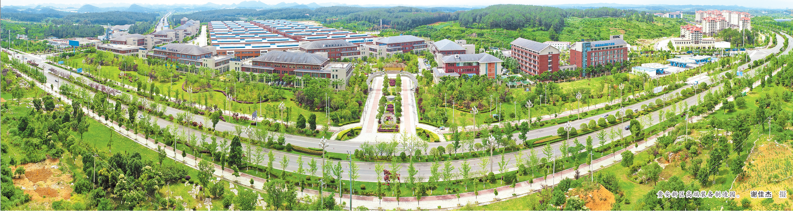
贵安新区高端装备制造园。

黔南州有序推进项目建设和持续深入开发区建设,开展“入企大走访、问题大化解、成效大比拼”活