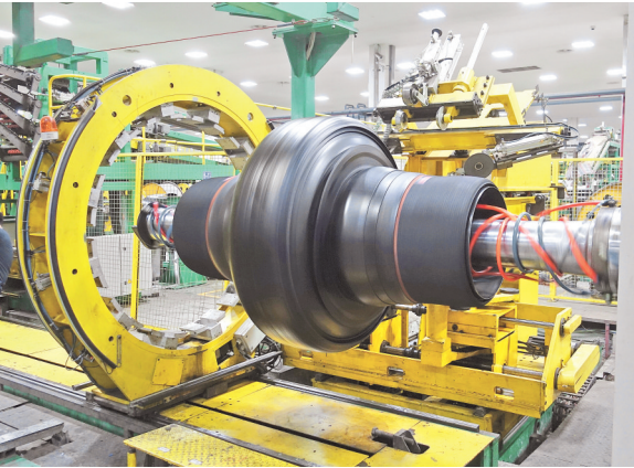
贵州轮胎厂生产车间。