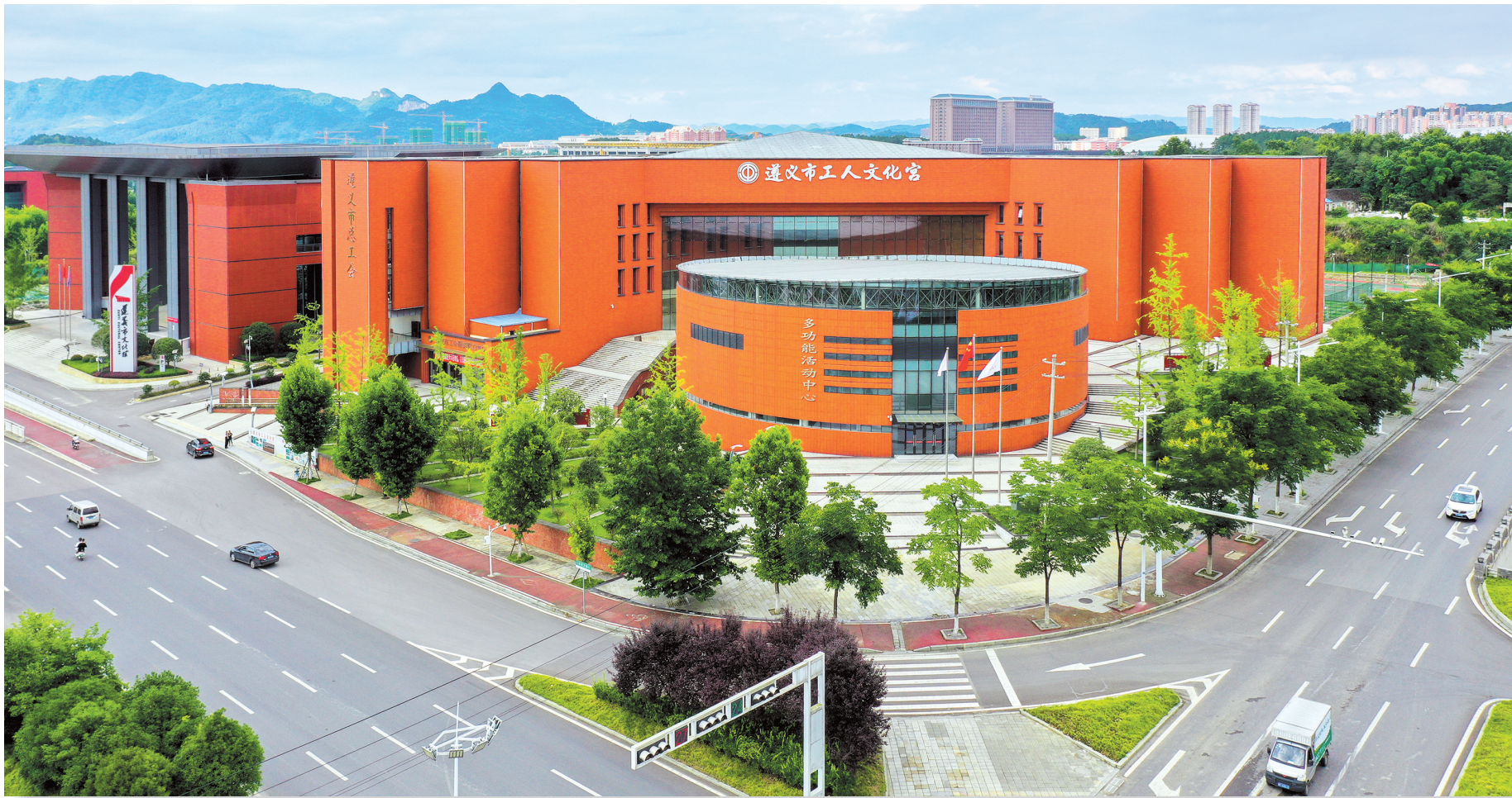
遵义市工人文化宫。