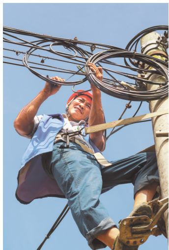
电力工人高空作业。

“我们将积极践行工人文化宫服务职工的公益性职能，努力建设职工‘学校和乐园’，凝心聚力建设‘文化+’发展服务模式，做好服务职工综合体建设。”遵义市总工会相关负责人说。