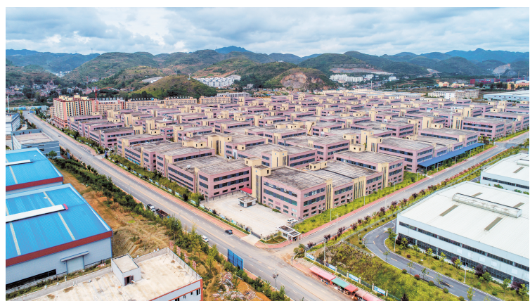
毕节金海湖新区。(毕节金海湖新区管委会供图)