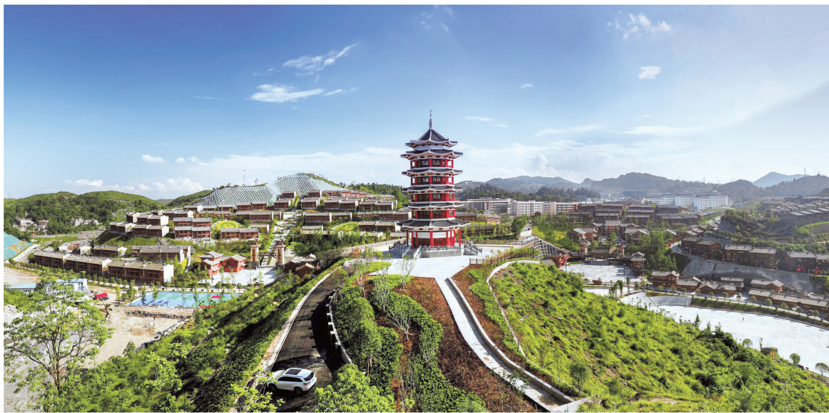
阿妹戚托小镇。