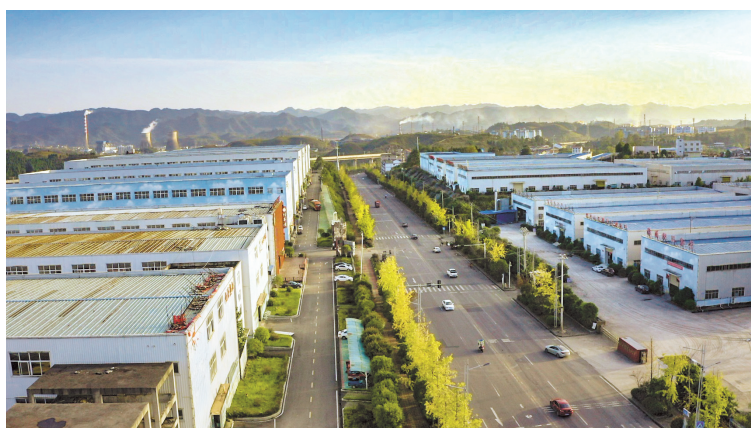
鸟瞰贵州大龙经济开发区。

阿妹戚托小镇的夜幕被华灯装点，当地彝族群众与远道而来的游客手拉着手围着小镇广场中央升腾的篝火尽情唱歌。今年“五一”长假期间，这座位于贵州省黔西南州晴隆县的少数民族特色小镇又迎来了一个旅游旺季。而在2018年3月前，这热闹的场景是当地人从没想过的。 曾经贴着“极贫”标签的三宝彝族乡，是5000多名阿妹戚托人的故乡。那里山高路远，土地贫瘠，唯有整乡搬迁，才能摆脱贫困。搬出了大山，来到按景区标准打造的新家园；搬进了现代化小镇，过上了靠旅游业“吃饭”的新生活。 近年来，阿妹戚托小镇的故事在贵州不断被续写，一个个特色小镇落地开花，结出了幸福生活的“蜜果”。同时，许多城镇在既有基础上推进产城融合，以城聚产、以产兴城，共同为全省实现“黄金十年”快速发展作出了重要贡献。 “十三五”时期，贵州大力实施城镇化带动战略，占全省生产总值比重已经超过75%的城镇经济，为新型工业化、新型城镇化、农业现代化、旅游产业化创造出巨大市场，成为推动高质量发展的重要引擎。 “十四五”开启新征程，贵州正以高质量发展为统揽，促进工业园区与城镇建设相互支撑、协调发展；积极培育城镇服务经济、消费经济、创新经济，加快城镇化进程，提升城镇的人口承载力、内需带动力、发展竞争力。 工业兴，百业兴。3月初，实施工业倍增行动、推动工业大突破的号令很快传遍了全省开发