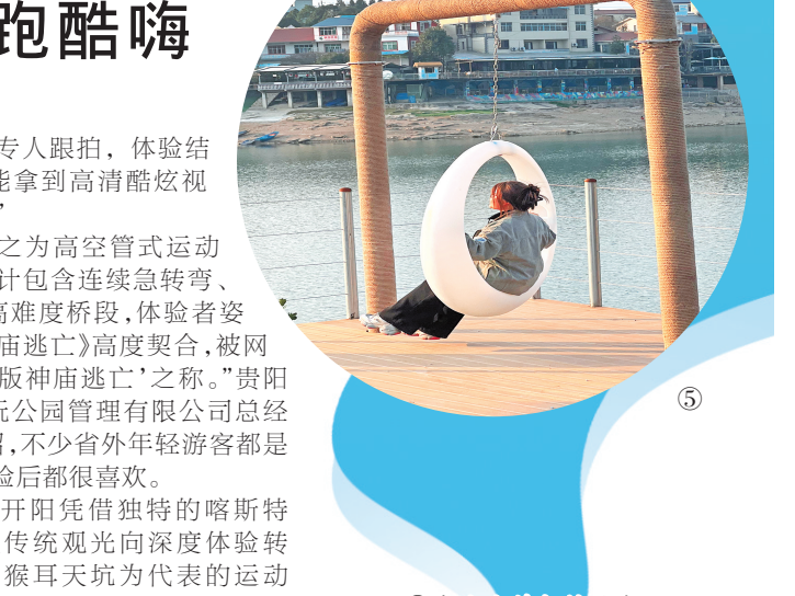
“五一”假期,息烽以“一红一绿”交出了假日旅游的答卷——一头连着红色记忆的温度,一头牵着康养休闲的热度。