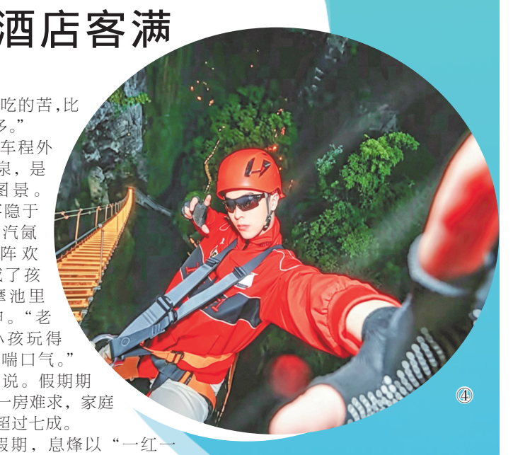
刚刚结束的“五一”假期,贵阳市息烽县文旅市场迎来客流高峰,红色研学与温泉康养两条主线齐头并进。