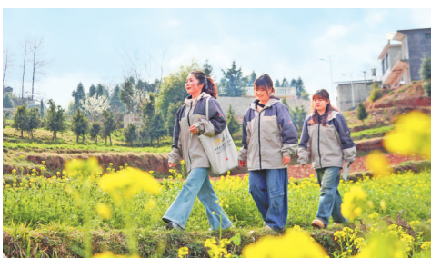
小海镇育婴辅导员和督导员在走访途中。