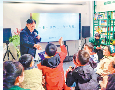
“小桔灯·悦读空间”开展阅读分享活动。

自2018年启动以来，“小桔灯”已在全省建立777个亲子阅读基地，培训近2000人次领读者，组织15.18万名“爱心妈妈”开展志愿服务。一个个嵌入社区、书屋、驿站和校园的“小桔灯”阅读空间，正不断把公益阅读服务送到更多群众身边。