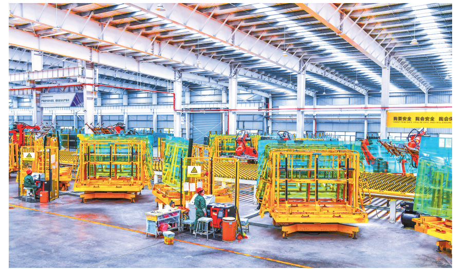
位于黔东南州凯里市的贵州海生玻璃有限公司工人在1.4毫米超薄玻璃生产线作业。