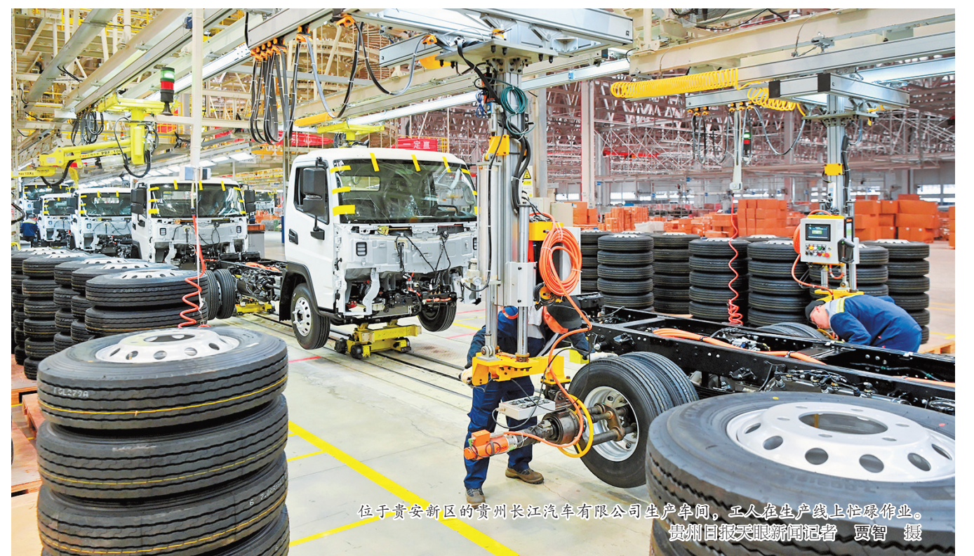
位于贵安新区的贵州长江汽车有限公司生产车间，工人在生产线上忙碌作业。