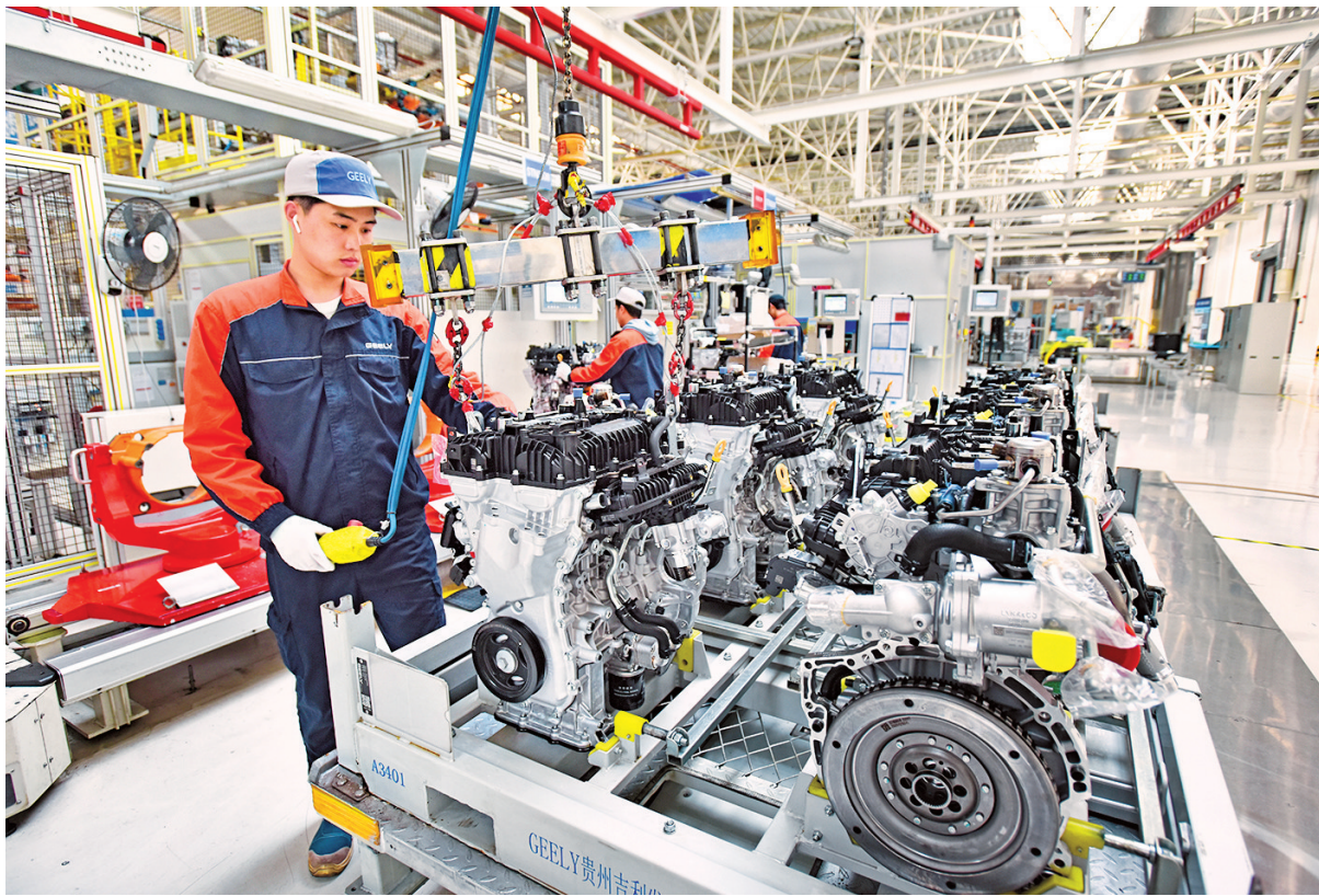
↑贵州吉利发动机装配车间内，工作人员精准操作。