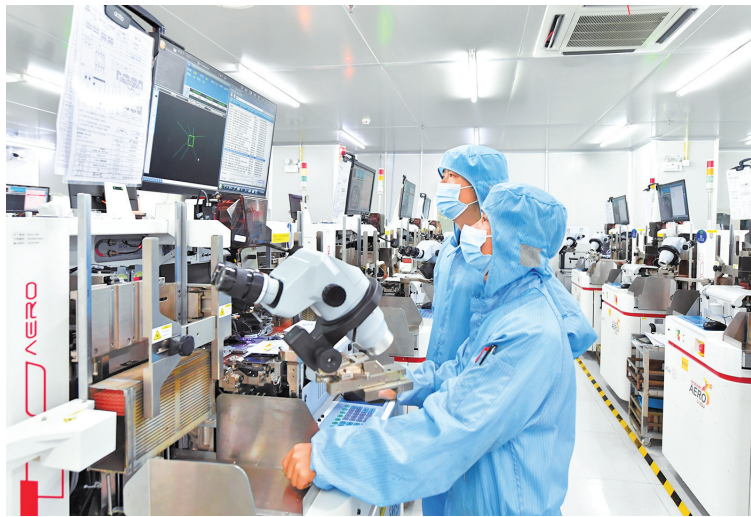
↓清镇经开区，贵州中芯微电子科技有限公司工人在生产电路芯片。