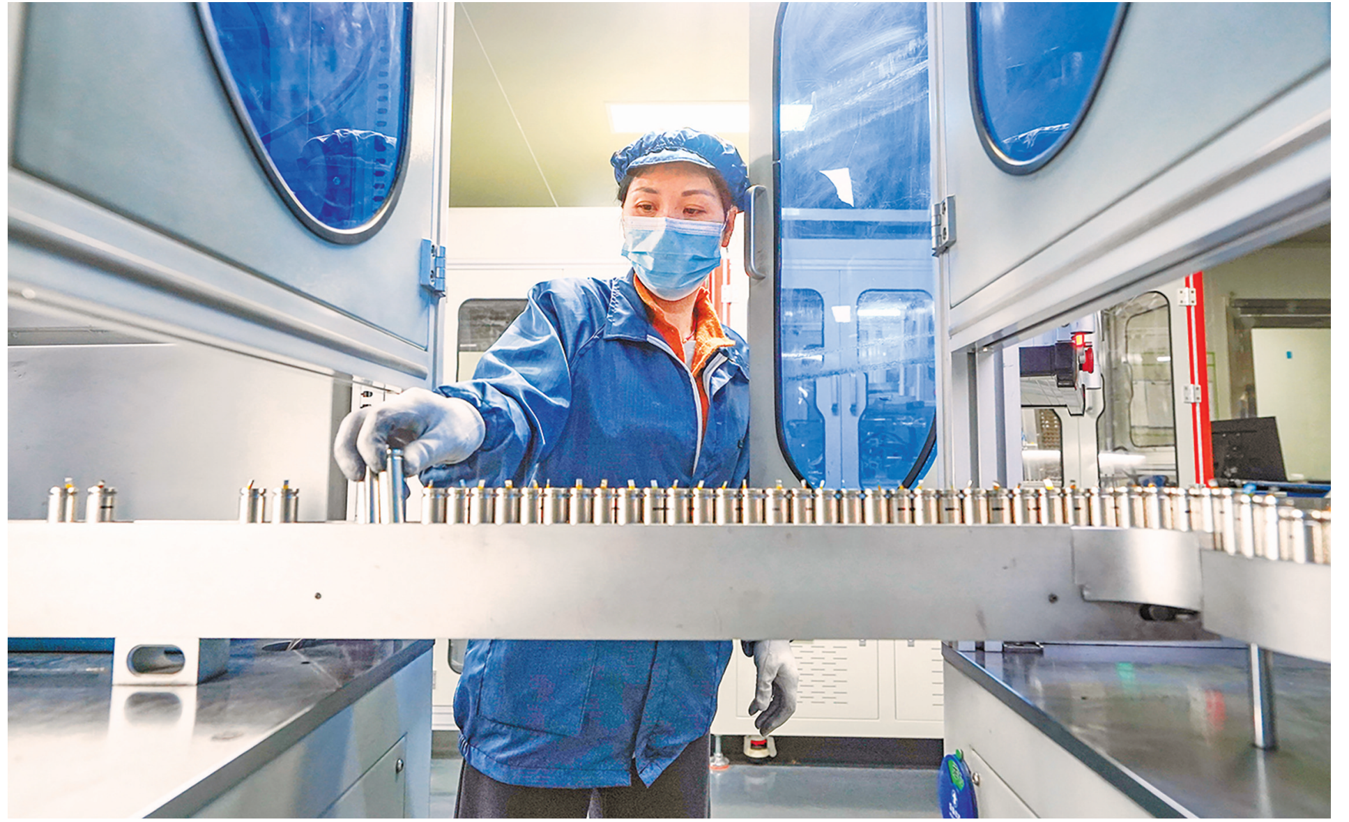
→工作人员在贵州贵航新能源科技有限公司的锂电池生产车间内作业。