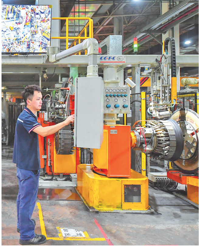
↑贵州轮胎“灯塔工厂”的智能化生产车间内，自动化生产线高效运转。