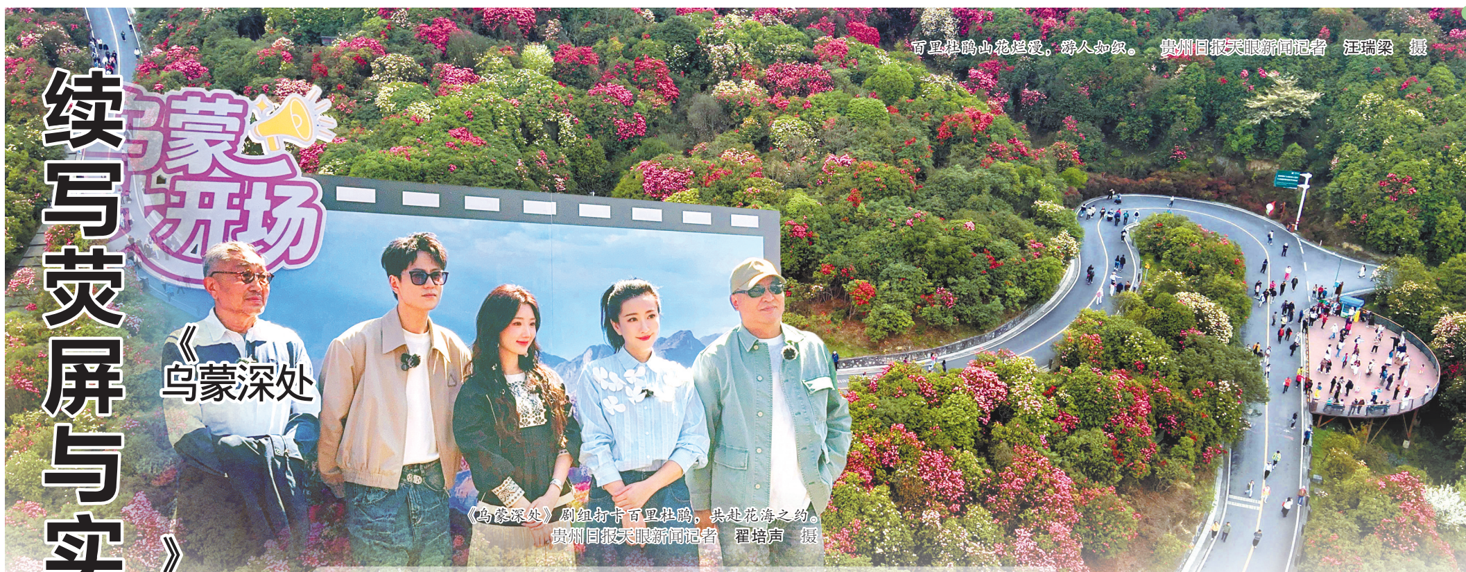
百里杜鹃山花烂漫，游人如织。