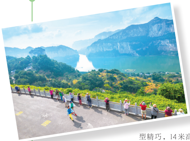
游客在化屋村观赏乌江源百里画廊峡谷风光。

此次演员实地推荐，进一步展现了织金独特魅力。当前，该县正持续深化文旅融合，以乌蒙深处的独特风光和人文底蕴，迎接八方游客前来探寻。