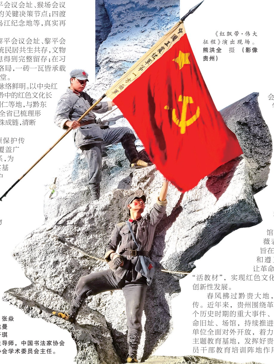
《红飘带·伟大征程》演出现场。

胜利邮局里最受欢迎的服务产品，是“写给胜利的一封信”。3月10日，游客张婉婷在这里给5年后的自己写下了一封信。“希望这封寄托着‘胜利’祝愿的信件，能给未