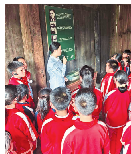
息烽青山新华希望小学学生走进息烽集中营旧址开展研学活动。

如今，红色讲堂、音乐思政课、基层宣讲已成为贵州培育文明新风的重要载体，红色文化浸润到社会方方面面。贵州正持续推动红色文化与精神文明建设深度融合，让红色故事成为育人教材，让红色基因转化为群众的行动自觉，让感恩奋进、忠诚担当的良好风尚在黔贵大地蔚然成风。