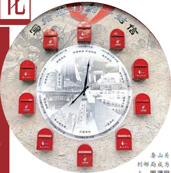
娄山关的胜利邮局成为打卡点。

3月的黔北，春风拂过娄山关的苍翠山峦。在遵义市汇川区板桥镇，娄山关红军战斗遗址陈列馆、西风台、夕照亭、观海楼等，吸引着四面八方的游客。其中，胜利邮局成为该线路中最具人气的打卡点之一，邮局分为集邮区与红色文化展示区，陈列着琳琅满目的集邮产品和文创产品。