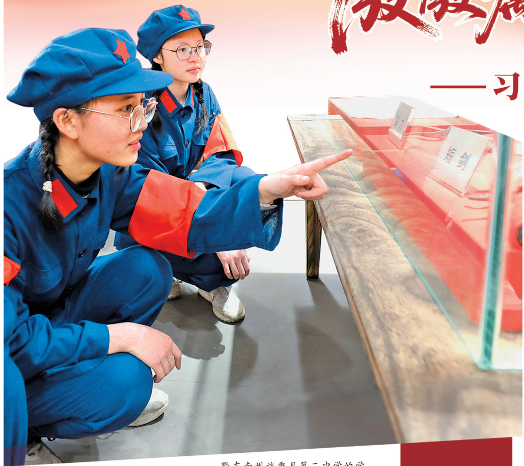
黔东南州施秉县第二中学的学生在红色教育基地了解红色故事。