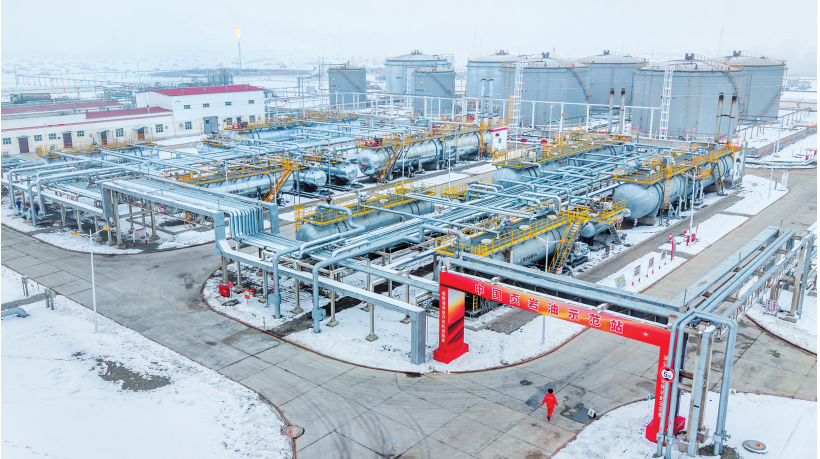
中国石油集团12月9日发布消息，我国首个国家级陆相页岩油示范区——新疆吉木萨尔国家级陆相页岩油示范区今年原油产量突破170万吨，标志着其国家级示范工程建设任务全面完成。图为新疆吉木萨尔国家级陆相页岩油示范区中国石油新疆油田页岩油联合站。