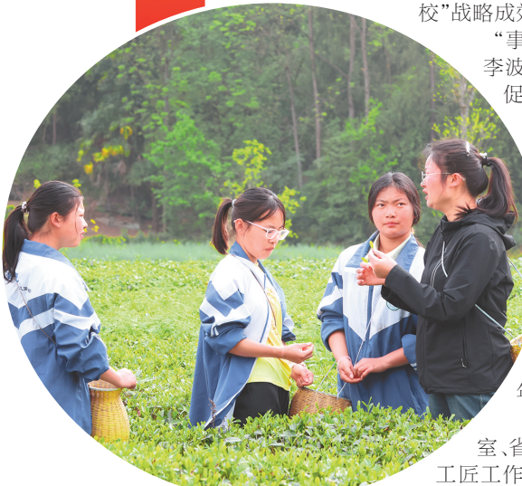
思南中等职业学校师生在产业基地实训上课。