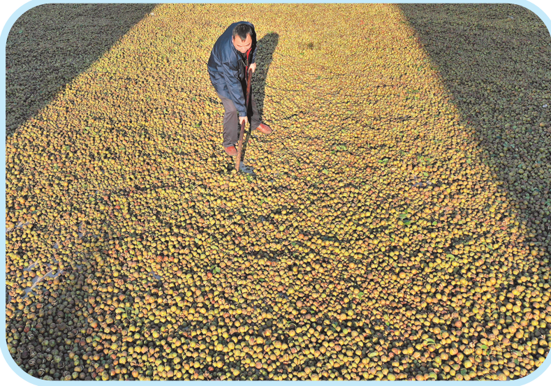
黔玉油茶开发有限公司工作人员在晒油茶果。