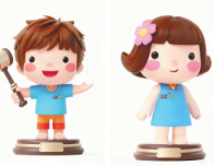
多娃和彩姐（省委网信办供图）