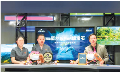
黔东南州荔波县人民法院世界环境日直播宣传活动。

黔东南州两级法院打造的“法治黔南”新媒体矩阵，将生硬法条转化为短视频、案例讲解和直播答疑，让法治之声在方寸屏幕间悄然流淌。