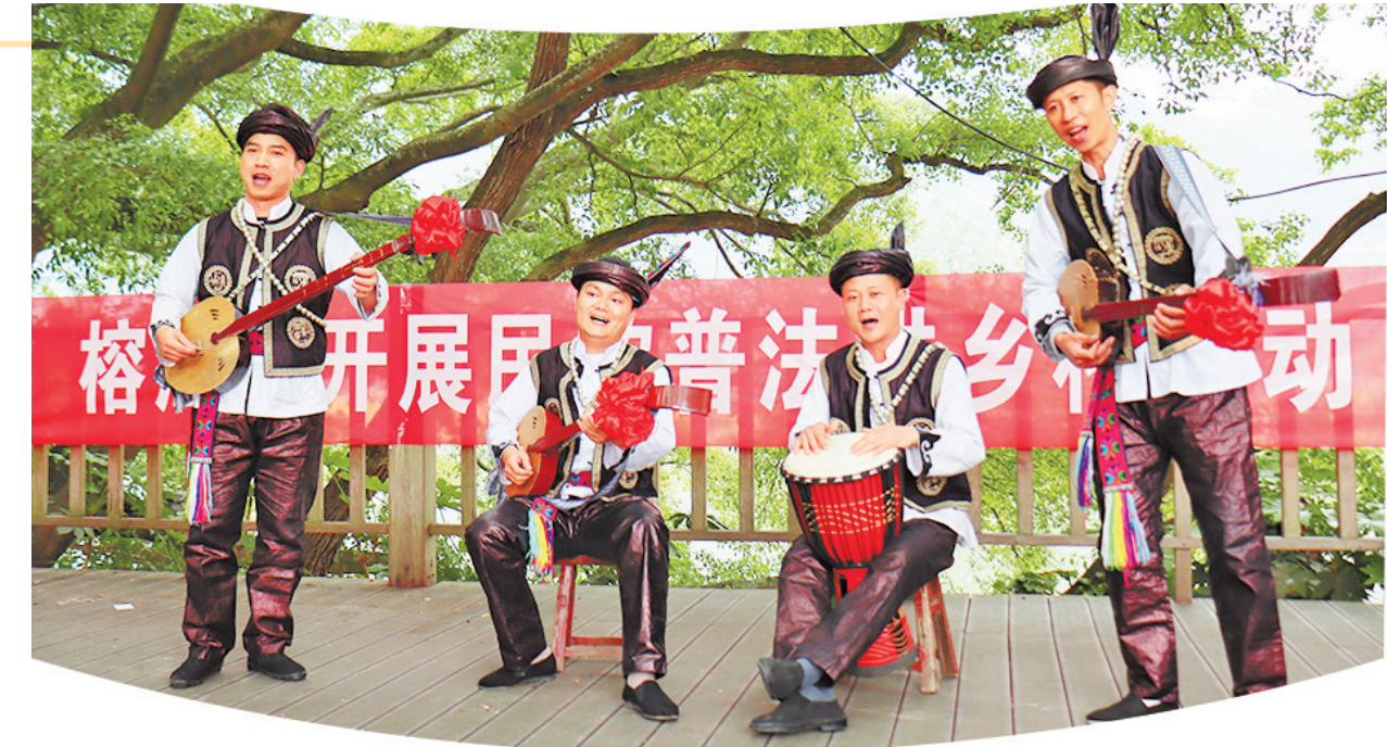
黔东南州榕江县开展民歌普法进乡村。（省司法厅供图）