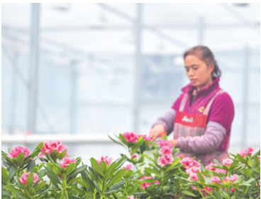
百里杜鹃管理区鹏程街道启化村汇境花卉科技园内,工作人员管护高山冷凉杜鹃花。

巍巍马蒙山见证岁月变迁,灼灼杜鹃花映照发展征程。“十四五”期间,百里杜鹃管理区以旅游为笔、以奋斗为墨,绘就了经济社会发展的精彩答卷。未来的百里杜鹃,必将以更加昂扬的姿态、更加务实的作风,在新时代的浪潮中,奋力谱写中国式现代化百里杜鹃新篇章。