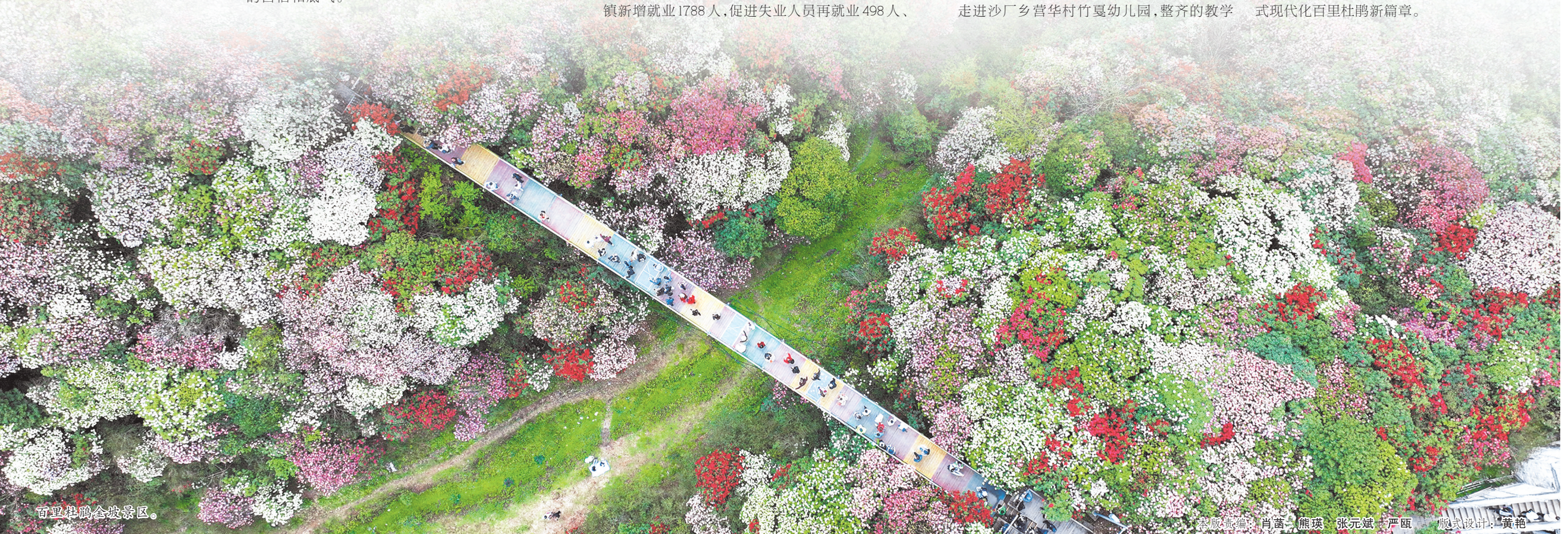
百里杜鹃全域旅游图。