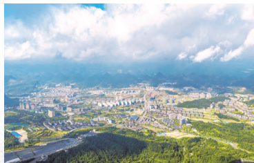
百里杜鹃管理区花都城区。