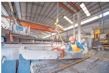
百里杜鹃管理区仁和乡大山石材厂内,工人在生产线上作业。