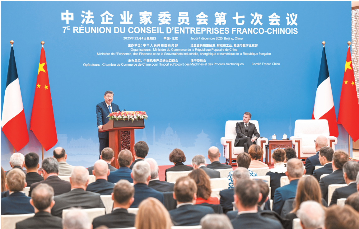
十二月四日中午，国家主席习近平在北京同法国总统马克龙共同出席中法企业家委员会第七次会议闭幕式并致辞。