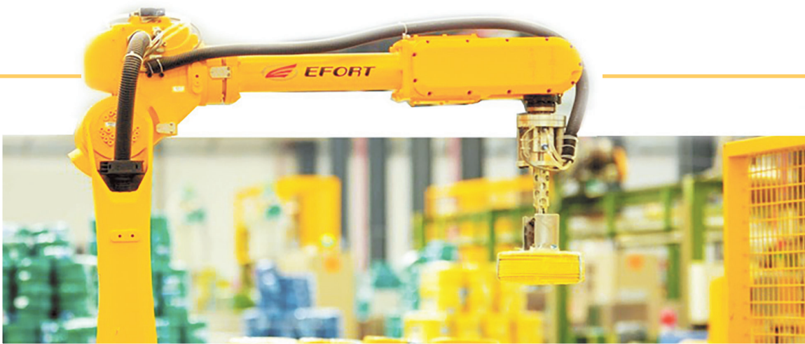
贵州玉蝶电工股份有限公司智能车间。