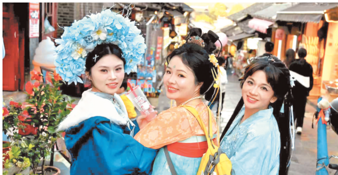
11月29日，贵阳市青岩古镇的青石板路上，往来游客化身“国风主角”，她们换上各种传统盛装，与百年古镇的建筑“同框对话”。

为丰富赛事体验，兴仁市同期举办了牛肉粉大赛、农特产品推广及趣味运动会等活动，并推出多项选手专属福利：凭号码布可享受免费温泉体验、酒店入住折扣，现场还为参赛选手发放牛肉粉免费品尝券，农特产品购买可享6至8.9折优惠，让选手在竞技之外尽享在地风情与暖心服务。