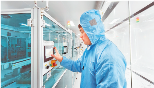
贵州集隼半导体产业园生产车间内，工作人员正在调整生产参数。