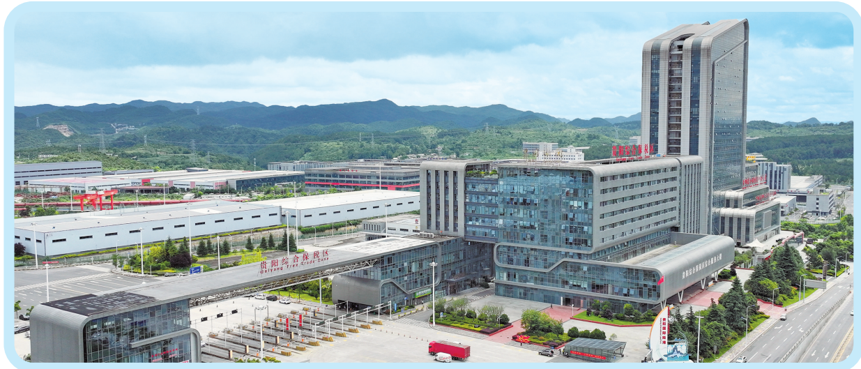
贵阳综合保税区。