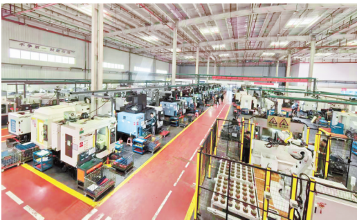
贵州鼎成熔鑫科技有限公司生产车间。