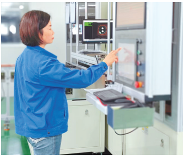
镇远县铝电解电容器智能化生产线。

11月5日,走进贵州炉碧经济开发区贵州海生玻璃有限公司车间,机械臂循着精准轨迹舞动,全自动化生产线上,一张张薄如蝉翼的玻璃匀速下线。作为黔东南州首个百亿级园区,这里正以资源精深加工为核心,奏响产业集群发展强音。 “2024年,炉碧经开区完成规上工业总产值113.71亿元。”炉碧经开区党工委委员、管委会副主任姜文大介绍,园区聚焦