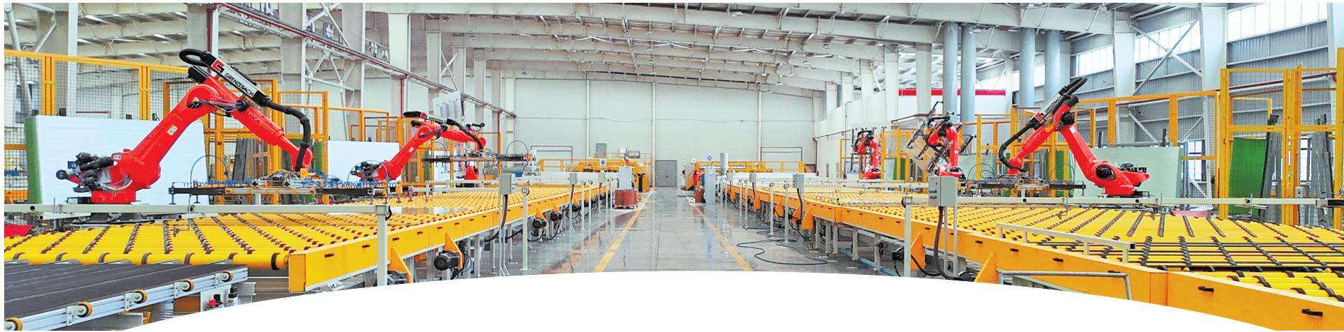
贵州海生玻璃有限公司生产车间。