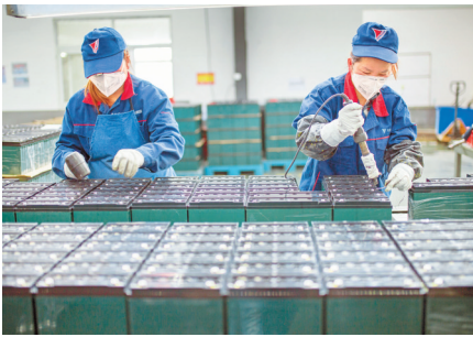
天能集团蓄电池生产车间工人在生产线上工作。