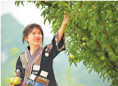
采摘蜂蜜李。

据统计，今年1月至9月，被评为“中国长寿之乡”的罗甸县，共接待外地游客440.98万人次。其中，接待前来康养度假人口约24760人次，常住康养人口238人次，实现旅游收入42.66亿元。 罗甸县旅游新业态融合趋势显著，旅游产业“出圈”更“出彩”。 “十四五”时期，罗甸县旅游发展持续发力。开展大小井、红水河等核心景区基础设施升级改造，红水河景区成为国家4A级旅游景区，大小井省级风景名胜区火爆出圈，创建省级乡村旅游重点村、镇共7个。常态化举办火龙果等水果采摘节，连续4年承办“奔跑贵州”暖冬户外运动和“全国钓鱼大赛”，先后获评“贵州省体育旅游示范县”“中国长寿之乡旅游文化服务示范县”“中国气候宜居城市（县）”。 乘着全域旅游的发展东风，罗甸县将再度奋楫扬帆，以崭新的形象与气质，开创旅游产业高质量发展的全新篇章。