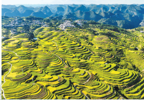
罗甸县羊场大米种植区。